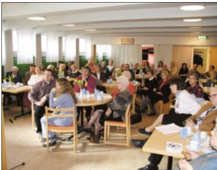
Många israelvänner samlades i Immanuelkyrkans församlingsvåning till årsmöte och berikande gemenskap.

Utdrag ur årsberättelsen (En fullständig årsberättelse kan beställas från exp.) Den pågående intifadnan har fortsatt att prägla situationen i Mellanöstern även detta år. Den antiisraeliskt vinklade mediabilden har givit ytterligare näring åt antijudiska